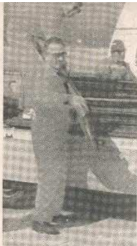
Volontari di "Piave '97"

Oltre mille volontari simulano l'emergenza