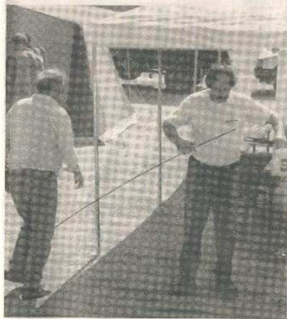
L'allestimento dei cantieri a La Cal di Limana

Lentiai - Il Comune li fornisce a un costo scontato del 50%